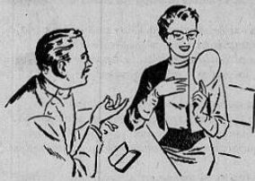
Anteojos en formas y Estilos Modernos

Detras de la Iglesia La Merced "DESPACHO RECETAS DE OCULISTAS"